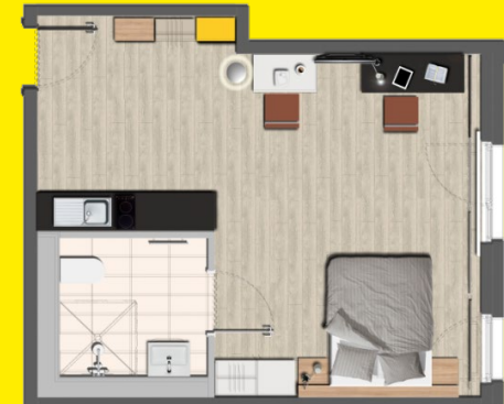
Beispielgrundriss mit Einrichtungsbeispiel Darstellung ohne Maßstab

COMFORT ZONE (bis zu 34 m 2 ) Komplett-Mietpreis 685 € / Monat * bei Belegung mit 2 Personen + 85 € / Monat *